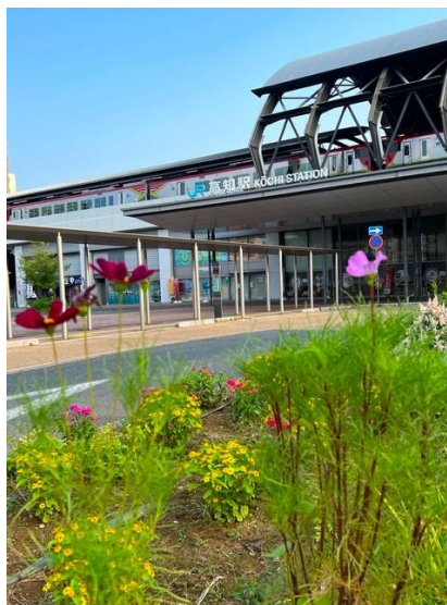
季節の花コスモス