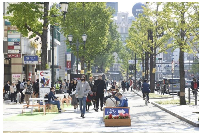
現在の御堂筋風景（右端が車道）

「みち」は昔から「通行の手段」として利用されてきましたが、クルマの発達と共に人間が疎外されているのではないかという問題意識から、人間中心の「ストリートデザイン」を研究して実践していこうという動きが広がっています。