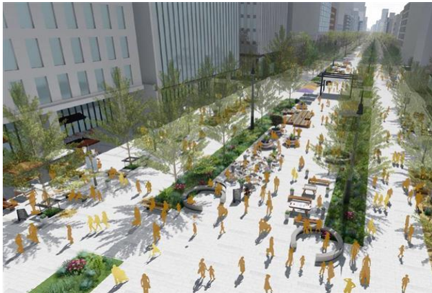
「御堂筋将来ビジョン」（車道を廃止）

「地方都市」の例に漏れず地盤低下に悩む大阪市は、「車中心から人中心のにぎわい空間」への転換によって、中心街の活力再生を目指しているそうです。はっきりしたビジョンを持って街づくりを進めている大阪に声援を送りたいと思います。