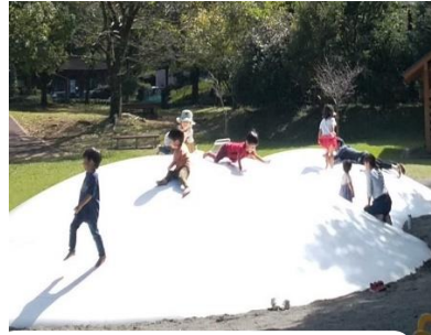
人気のふわふわドーム (やわらかいトランポリン)