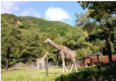
アフリカゾーンにて

入ってすぐの場所に、お客様の口コミがパネルで掲示されていました。「広い敷地、自然に近い環境で動物たちが活動」、「清掃が行き届いている」、「からくり時計や遊具に子供が夢中」、「夜の動物園など企画展がいい」、「コスパが良い（入園料は大人460円、18歳未満無料、レストランは美味しくて値段が手ごろ、ソフトクリーム250円・・・）」。ナルホドと納得しました。