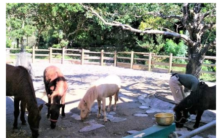
ロバたちはランチタイムでした

聞けば、「脱柵(さく)・脱コンクリート」が当園のモットー。恵まれた環境の中でのびのびと過ごす動物たちを目前に観ることができます。近寄って触ったり、ロバにまたがったり、遊具とベンチが点在する原っぱ（ピクニック広場）で駆け回ったり…子供たちがワクワクする仕掛けがいっぱい。家族連れのリピーターが多いのもうなずけます。若者たちも目立ちます。童心に帰ることができる格好のデート場所かもしれません。