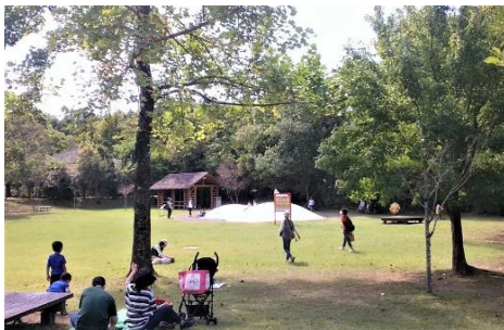
広場で子供が遊び親は休憩

聞けば、「脱柵(さく)・脱コンクリート」が当園のモットー。恵まれた環境の中でのびのびと過ごす動物たちを目前に観ることができます。近寄って触ったり、ロバにまたがったり、遊具とベンチが点在する原っぱ（ピクニック広場）で駆け回ったり…子供たちがワクワクする仕掛けがいっぱい。家族連れのリピーターが多いのもうなずけます。若者たちも目立ちます。童心に帰ることができる格好のデート場所かもしれません。