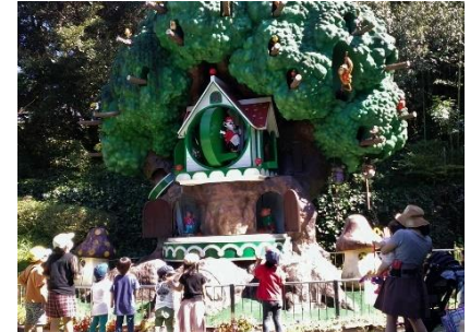
「おとぎの森」のからくり時計

テレビ報道などでご存じかもしれませんが、今夏はお目出度相次ぎました。7月にマンドリル（尾長ざるの仲間）とアシカ、8月は日本でここにしかないセネガルショウノガン、9月はナマケモノなど。人間界の少子化どこ吹く風です。