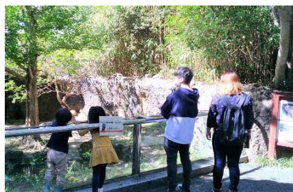
「あっ、あそこ！おいでおいで」